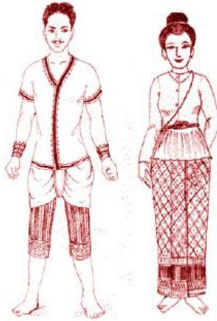
การแต่งกายสมัยอยุธยา

https://www.baanjomjut.com/library_2/history_of_costume/02_5.html