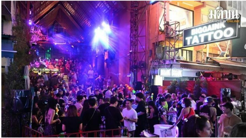
ททท. แจงไอเดีย

ธุรกิจ ชง ศบค. ขยายเวลาเปิดผับถึงตี 4 เฉพาะเมืองท่องเที่ยวหลัก พื้นที่ทัวริสต์สูง