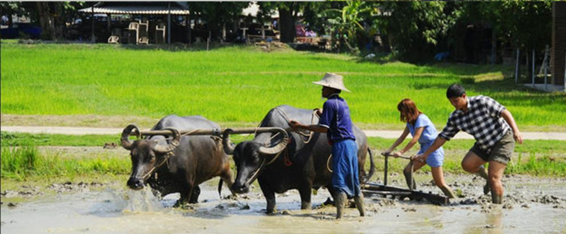
Buffalo village -- http://www.suphan.biz/Villagebuffalo.htm