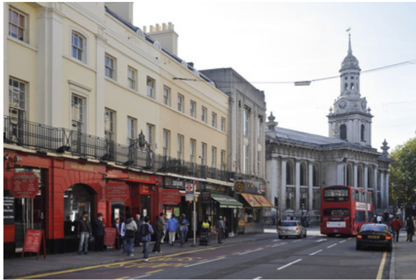
Greenwich Town, London