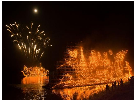
ภาพ 3 แหล่งท่องเที่ยวประเภทมนุษย์สร้างขึ้น (แหล่งท่องเที่ยวประเภทวัฒนธรรมและประเพณี)