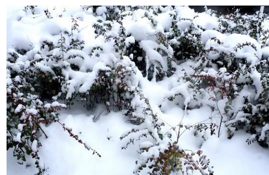
ภาพ 1 แสดงภาพแหล่งท่องเที่ยวประเภทธรรมชาติสร้างขึ้น