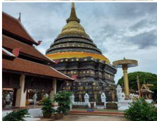
ภาพ 2 แหล่งท่องเที่ยวประเภทมนุษย์สร้างขึ้น (แหล่งท่องเที่ยวประเภทประวัติศาสตร์)