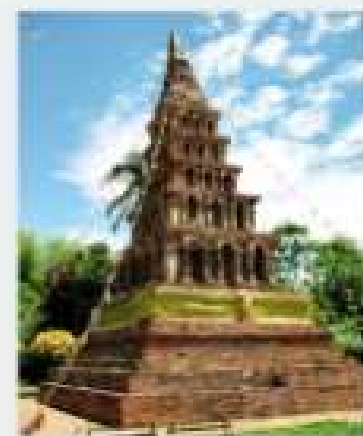
สุโขทัย-สุโขทัย แหล่งประวัติศาสตร์เมือง สุโขทัย-สุโขทัย