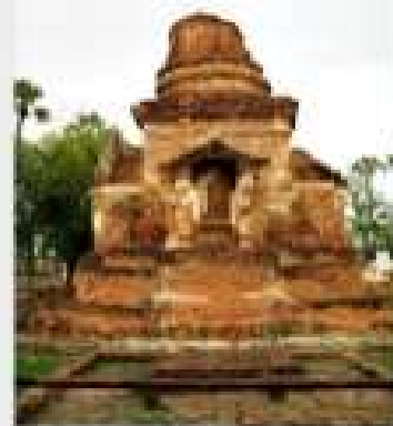
สุโขทัย-สุโขทัย แหล่งประวัติศาสตร์เมือง สุโขทัย-สุโขทัย