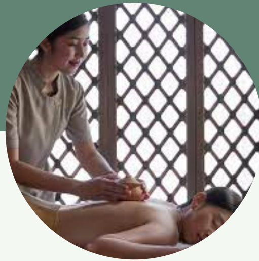
กลุ่ม B กลุ่มลูกค้าระดับกลาง