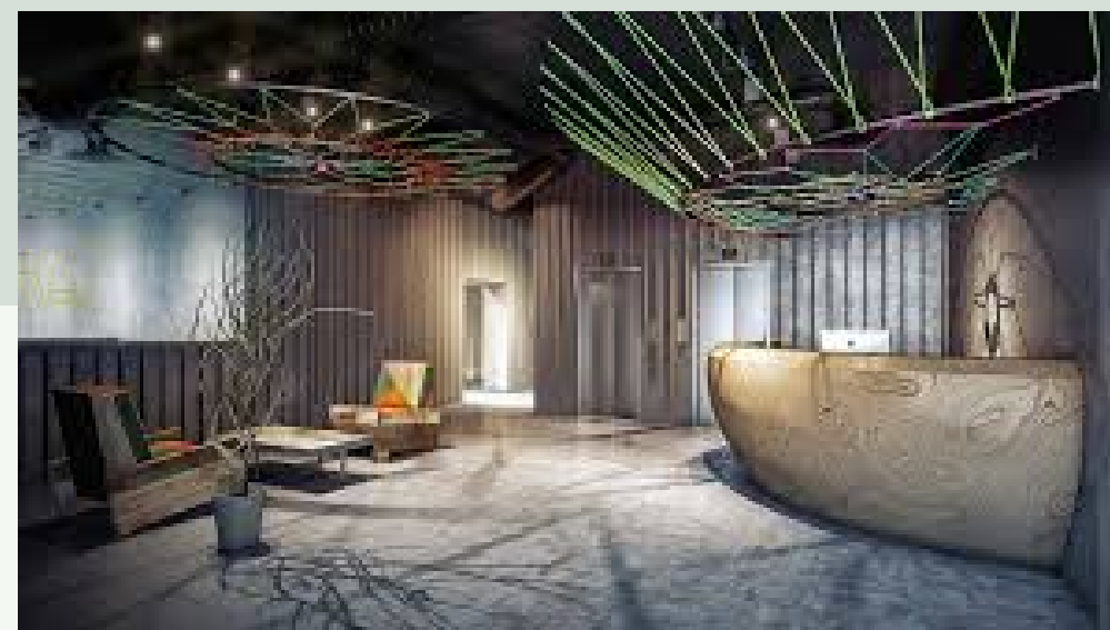
ส่วนต้อนรับลูกค้า