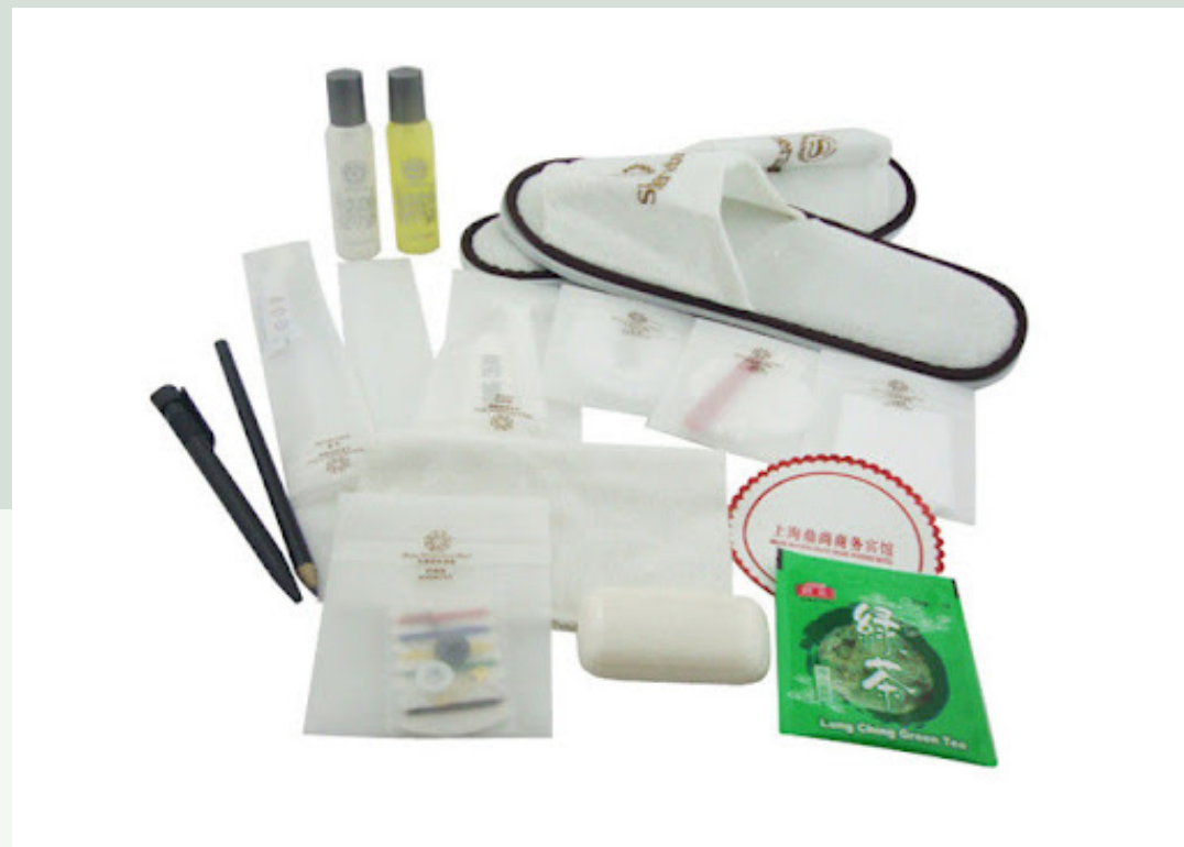
วัสดุอุปกรณ์