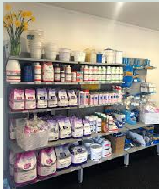
พื้นที่ชกรีดและพื้นที่เก็บผลิตภัณฑ์