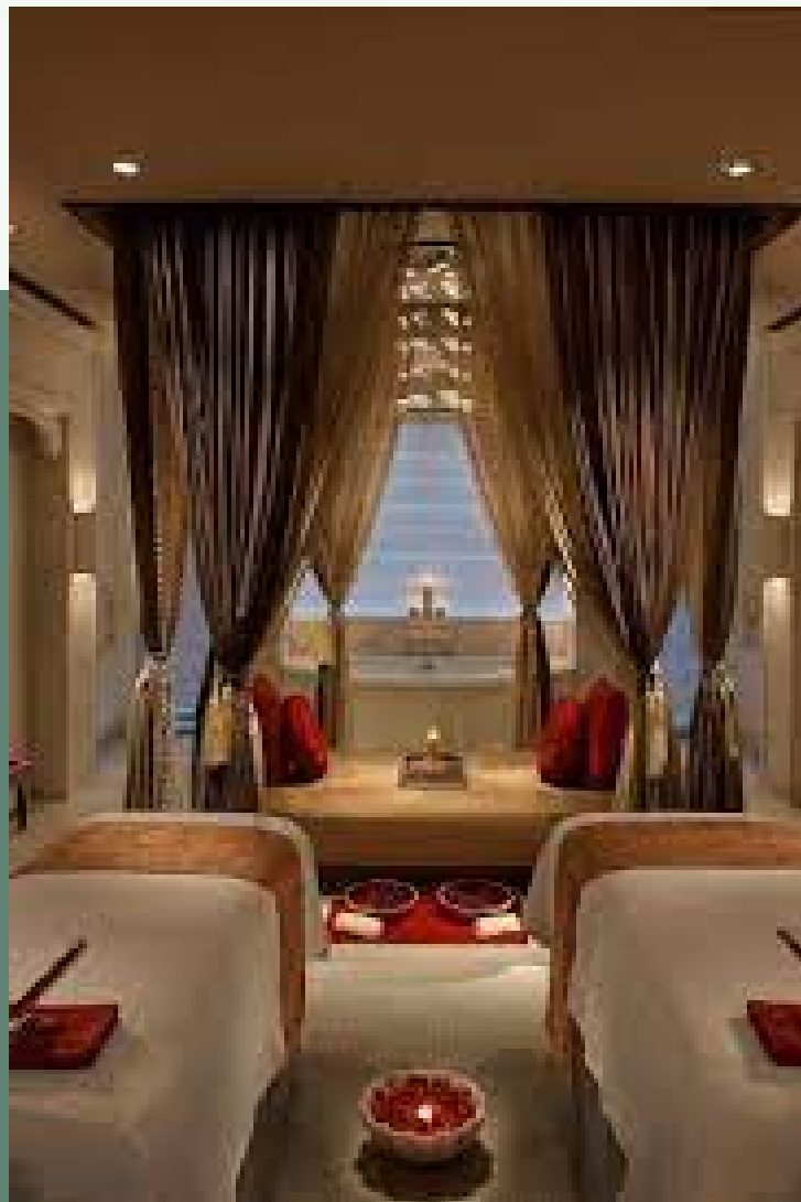
บรรยากาศ หรือ สไตล์ของ สปา