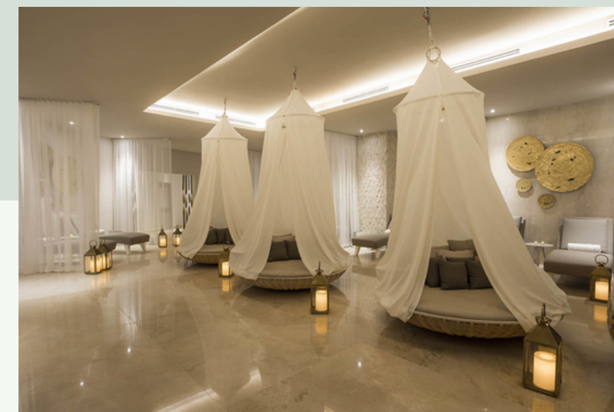
ส่วนพักผ่อนสำหรับลูกค้า