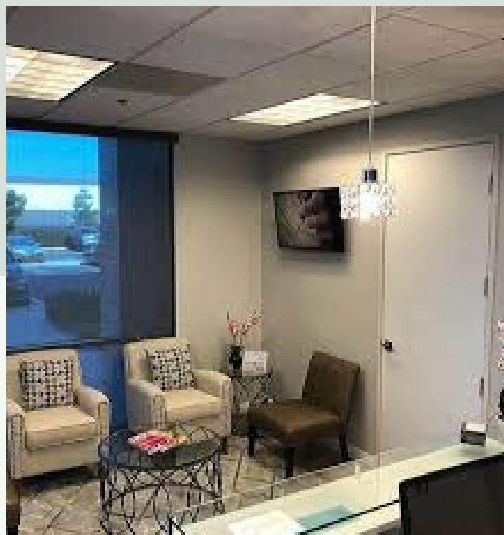
ส่วนพักผ่อนของพนักงาน