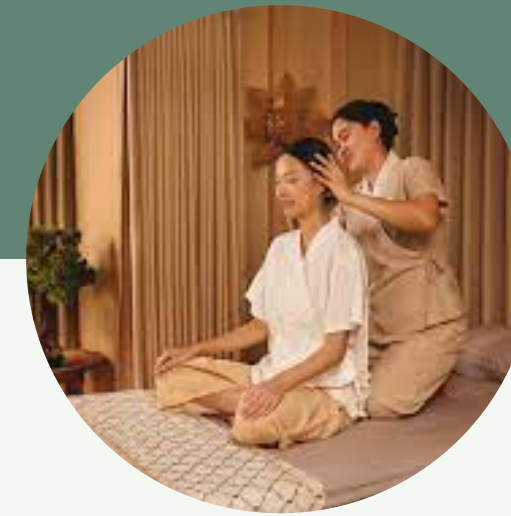
กลุ่ม C กลุ่มลูกค้าระดับทั่วไป