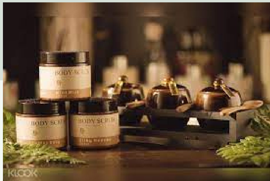
ผลิตภัณฑ์