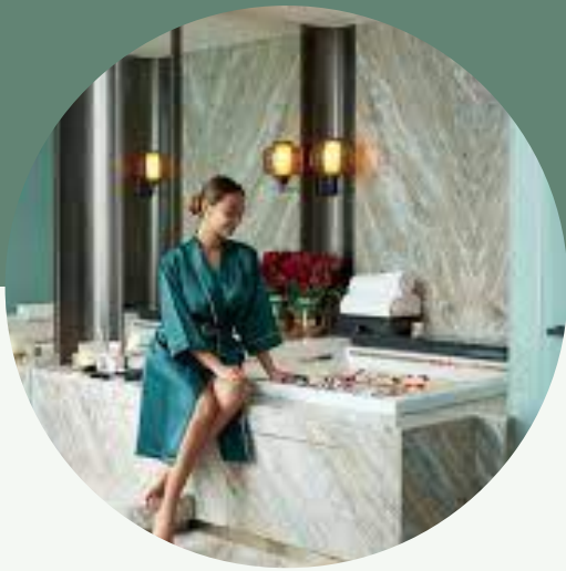
กลุ่ม A กลุ่มลูกค้าระดับสูง