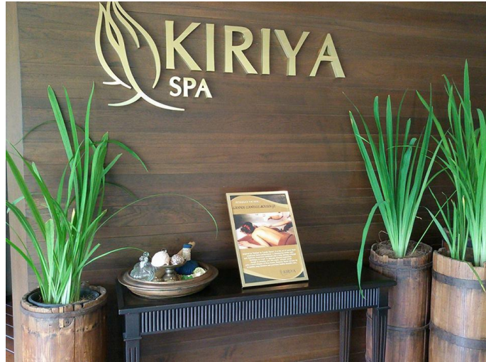
ภาพที่ 1.6 Kiriya Spa

ผู้ใช้บริการที่ต้องการหลีกเลี่ยงความวุ่นวายในเมือง และชีวิตประจำวัน ตัวอย่างเช่น เซ็นวาริสปา โรงแรมเซ็นทารา คูล สปา โรงแรมศรีพันวา ภูเก็ต เทวัญดาราสปา โรงแรมดุสิตธานี เป็นต้น