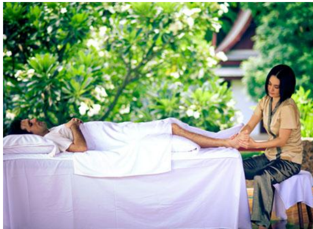
ภาพที่ 1.5 เสดดินชั้นสปา

เศสดินชั้นสปา หรือสปาครบวงจร คือ สถานบริการสปาที่ให้บริการด้านการดูแลและเสริมสร้างสุขภาพด้วยบริการสปาพร้อมที่พัก อยู่ใกล้แหล่งทรัพยากรธรรมชาติและมีความเป็นส่วนตัว มีสิ่งอำนวยความสะดวกต่าง ๆ สำหรับผู้ให้บริการอย่างครบวงจร เช่น การนวดรูปแบบต่าง ๆ การบำบัดด้วยน้ำ เป็นต้น ผู้มาพักโดยมากจะพำนักเป็นระยะเวลานาน เพื่อผ่อนคลายและปรับปรุงวิถีชีวิตให้ดีขึ้น ปรับความสมดุลของร่างกายและจิตใจ โดยมีผู้จัดโปรแกรมให้เหมาะสมกับลักษณะสุขภาพของแต่ละคน ผู้เข้าพักจะต้องเข้าร่วมกิจกรรมต่างๆที่สถานบริการจัดเตรียมไว้ เช่น โปรแกรมการทำสมาธิและดูแลสุขภาพจิต โปรแกรมการรับประทานอาหารเพื่อสุขภาพ เป็นต้น ราคาบริการค่อนข้างสูง เสดดินชั้นสปาในประเทศไทยที่มีชื่อเสียงและเปิดให้บริการเป็นที่แรกคือ ชิวาสอม อำเภอหัวหิน จังหวัดประจวบคีรีขันธ์ นอกจากนี้ยังมีเศสดินชั้นสปาที่มีชื่อเสียงในประเทศไทยอีกหลายแห่ง เช่น ระลินจินดา เวลเนสสปา จังหวัดกรุงเทพฯ เต่าการ์เดน เฮลธิ์รีสอร์ท จังหวัดเชียงใหม่