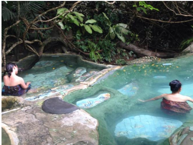
ภาพที่ 1.4 น้ำพุร้อนสปา

น้ำพุร้อนสปา คือการให้บริการสปาตามแหล่งท่องเที่ยวที่เป็นบ่อน้ำแร่ หรือน้ำพุร้อนที่เกิดขึ้นตามธรรมชาติ ถือเป็นรูปแบบดั้งเดิมของสปาที่ได้รับความนิยมในต่างประเทศ เนื่องจากน้ำพุร้อนและน้ำแร่มีแร่ธาตุต่าง ๆ ที่ช่วยในการบำบัดรักษาโรคบางชนิดได้ เช่น โรคปวดไขข้อ โรคทางเดินปัสสาวะผิดปกติ เป็นต้น โปรแกรมการบริการจะเน้นการบำบัดโดยใช้ความร้อนจากน้ำหรือน้ำแร่ต่างๆ ประเทศไทยมีแหล่งน้ำพุร้อนตามธรรมชาติในหลายจังหวัดซึ่งกำลังได้รับการพัฒนาเพื่อรองรับนักท่องเที่ยวในอนาคต ตัวอย่างน้ำพุร้อนสปาในประเทศไทย เช่น วาริรักษ์ จังหวัดกระบี่ ปายฮ็อทสปริงสปา จังหวัดแม่ฮ่องสอน เป็นต้น