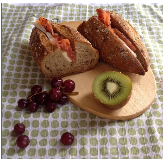
ภาพที่ 1.9 อาหารเพื่อสุขภาพ

2. รส หมายถึง รสชาติของอาหารและเครื่องดื่มที่สร้างความอร่อยลิ้น มีประโยชน์และเสริมสร้างสุขภาพต่อร่างกาย เชื่อกันว่ารสชาติของอาหารสามารถส่งผลทางอารมณ์และความรู้สึกต่อคนเราเป็นอย่างมาก เช่น เมื่อเรารับประทานอาหารที่เราชอบ หรือมีรสชาติที่อร่อยมากเกินไป จะทำให้เรารู้สึกไม่สบาย อึดอัด และหงุดหงิดในภายหลัง หรือรสชาติอาหารที่ไม่ถูกปากอาจทำให้ผู้รับประทานรู้สึกไม่สบายเป็นต้น ดังนั้น สปาส่วนใหญ่ที่ให้บริการอาหารและเครื่องดื่มจึงจำเป็นต้องให้ความสำคัญพิถีพิถันกับเรื่องรสชาติอาหารและเครื่องดื่มค่อนข้างมาก นอกจากนี้ในปัจจุบันความนิยมในการรับประทานอาหารธรรมชาติมีมากขึ้นเนื่องจากเชื่อกันว่าอาหารเหล่านี้มีคุณสมบัติในการล้างพิษ และลดมลพิษในร่างกาย จึงทำให้โภชนาการเข้ามามีบทบาทในธุรกิจสปาและเป็นจุดขายอีกอย่างหนึ่งที่ได้รับคามนิยม