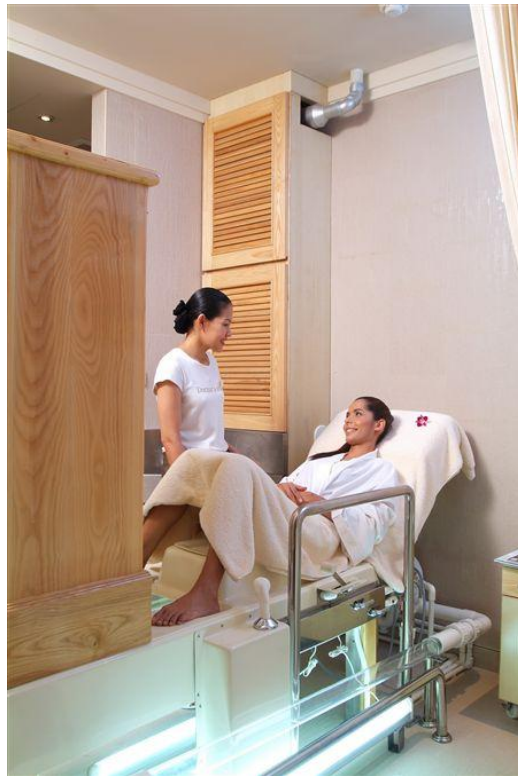
ภาพที่ 1.8 เมดิคอลสปา