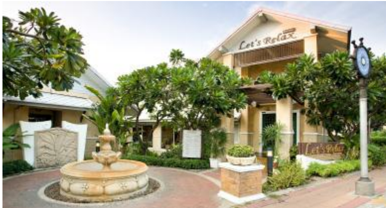
ภาพที่ 1.7 เคย์สปา