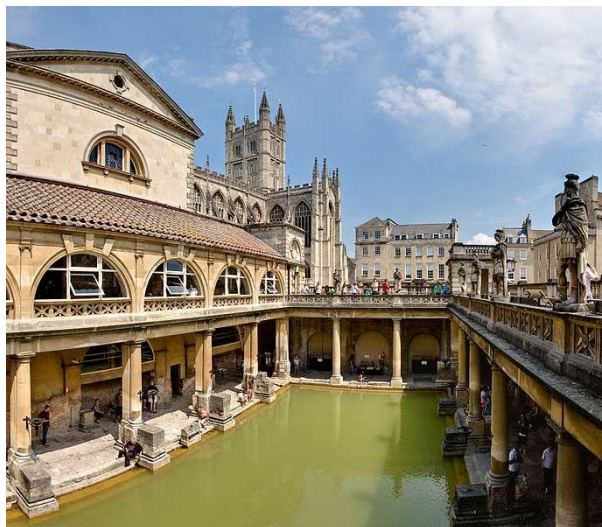
ภาพที่ 1.3 Roman Thermae